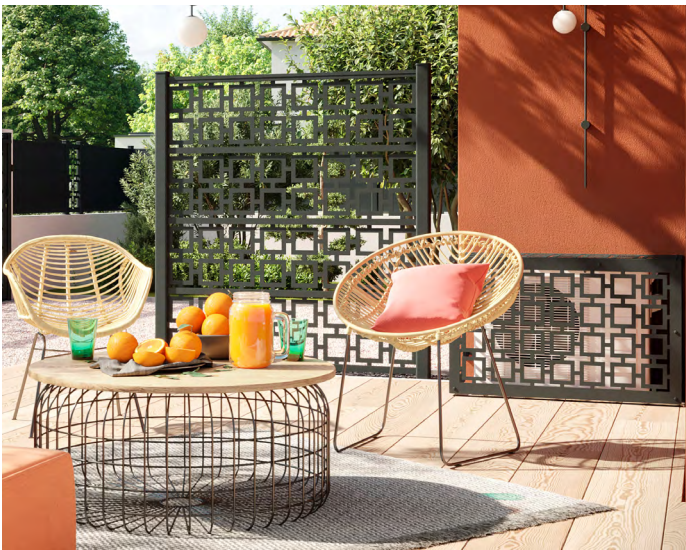
Claustra 4 panneaux décors FRAMM et habillage de climatiseur décor FRAMM coloris noir 9005

Pour un jardin ou une terrasse encore plus harmonieux.se , «Klaustra» s'accorde au décor d'un portail, d'une clôture, ou aux habillages extérieurs d'équipement tels qu'une pompe à chaleur, une climatisation, des spots..., afin de sublimer les espaces et se fondre dans le paysage et les éléments.