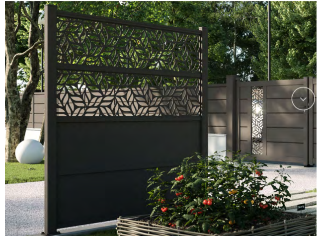
Claustra 4 panneaux décor Amand coloris gris sablé 2900 ©Kostum

Le motif Lorette s'inspire des Moucharabieh et rappelle le principe de cannage des grilles de jardin, ici travaillé façon monogramme, comme un ultime clin d'œil à l'univers du luxe et de l'élégance à la française.»