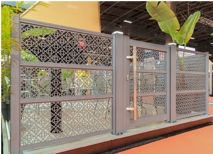
Claustras 4 panneaux avec portillon intégré, décor LORETTE, coloris gris bleu 7031