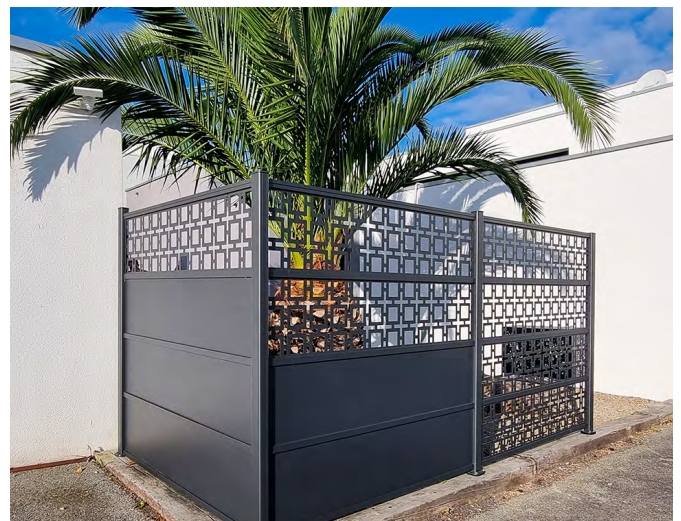
Claustras 4 panneaux en angle, alternance de panneaux pleins et décor FRAMM, coloris gris 7016

«Nous avons misé sur la modularité esthétique, car cette nouvelle gamme de claustras ouvre un incroyable éventail de possibilités pour agencer les espaces extérieurs et créer un véritable cocon dans lequel on se sent bien et en sécurité. Cette gamme répond aux attentes de différenciation et de personnalisation des architectes et des paysagistes, comme des particuliers.» explique Katell Gaiffas, Responsable Marketing & Communication – Société Cadiou .